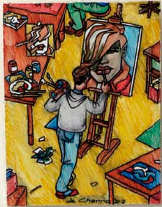
Anoniem Vier panelen, 2007 Viltstift op doek, 4 x 40 x 30 cm