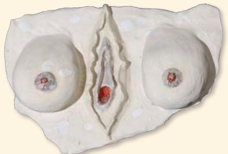
Anoniem Zonder titel Gemengde techniek op papier, 100 x 70 cm