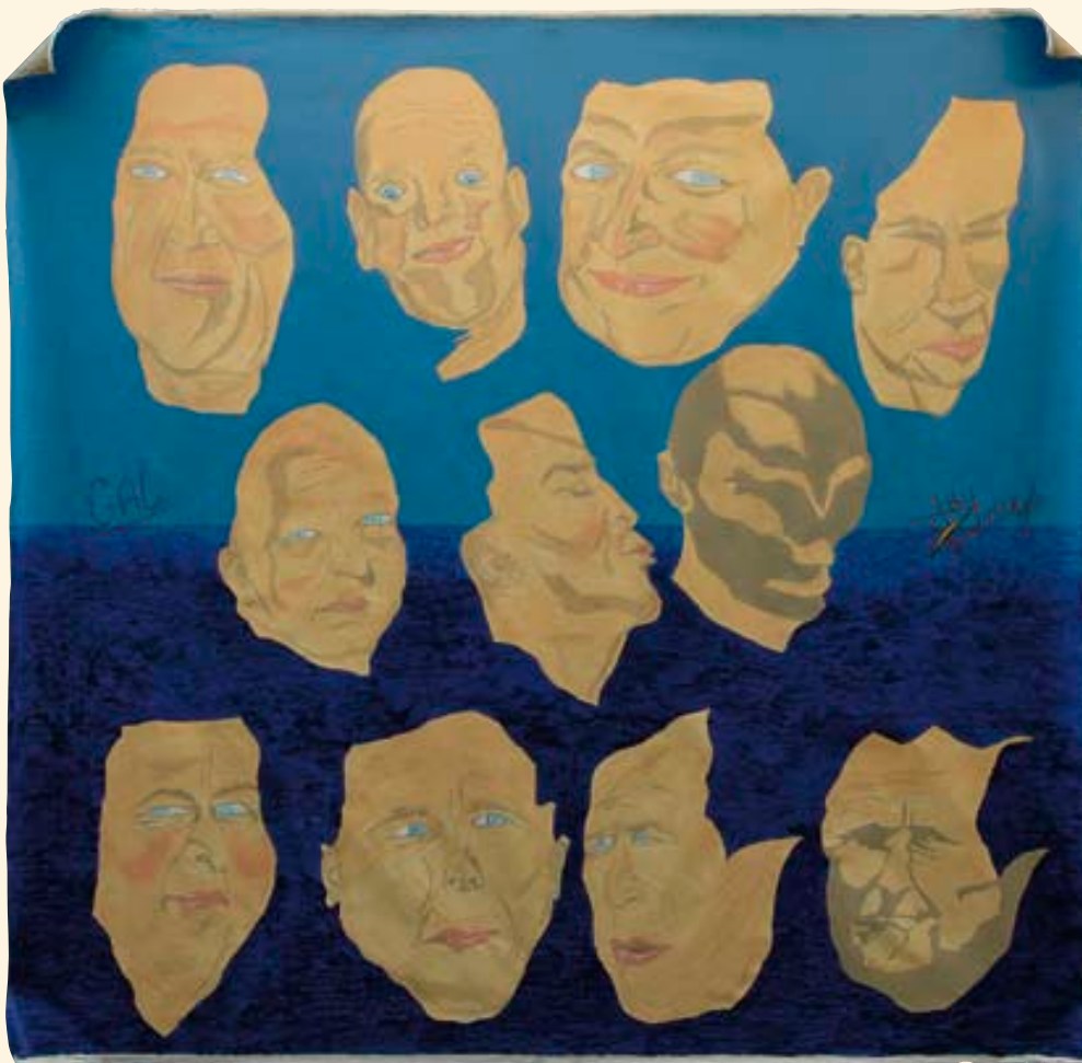
Maylon S. Zonder titel, 2007 Acryl op canvas, 250 x 250 cm

Binnen de Justitiële Inrichtingen vught zijn verschillende groepen gehuisvest. Zo is daar de EBI →