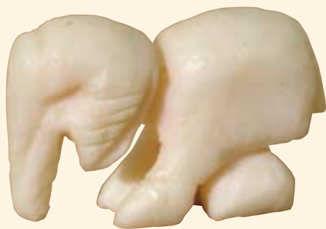
Anoniem Zonder titel Zeep, hoogte 5 cm

(Extra Beveiligde Inrichting) voor vluchtgevaarlijke gedetineerden en een zogenaamde Long Stay waar mensen zitten die hun tbs behandeling (terbeschikkingstelling van de regering, vroeger afgekort als tbr) hebben afgesloten, maar die vrijwel zeker niet in de maatschappij kunnen terugkeren. Verder is er een afdeling voor gedetineerden met een psychische stoornis, een terroristen afdeling en is er een speciale afdeling voor jeugdigen. Bij elkaar opgeteld gaat het hier eigenlijk om allerlei gevangenis- en in één. Overal zijn hoge muren, tralies, hekken en elektronische beveiliging.